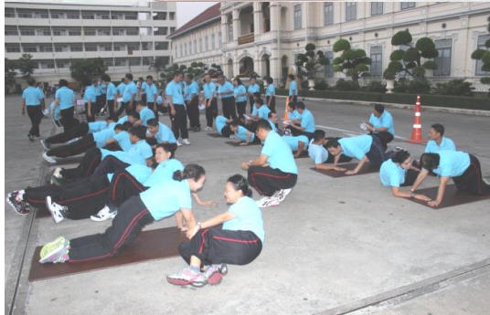
สบ.ทบ.ทำการทดสอบสมรรถภาพร่างกาย กำลังพล ประจำปี ๒๕๕๗ ครั้งที่ ๑ ณ ลานหน้าอาคารพิพิธภัณฑท์ บก.ทบ. เมื่อ ๒๖ ก.พ. ๕๗ และ ๒๘ ก.พ. ๕๗