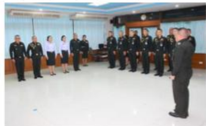
พล.ต. วีรสิทธิ์ จันทร์ดา จก.สบ.ทบ.เป็นประธานในพิธีประดับยศนายทหารสัญญาบัตรที่เลื่อนยศสูงขึ้น เมื่อวันที่ ๑๕ พ.ย. ๖๒ ณ ห้องพิธี สบ.ทบ.