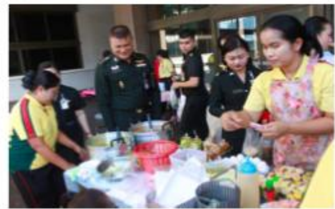
พล.ต. วีรสิทธิ์ จันทร์ดา จก.สบ.ทบ. ได้กรุณาให้จัดกิจกรรม “ส่งเสริมเพิ่มรายได้ให้กับกำลังพล สบ.ทบ.” เมื่อวันที่อังคารที่ ๒๖ พ.ย. ๖๒ บริเวณหน้าลิฟท์ อาคาร ๓ ชั้น ๑ สบ.ทบ.